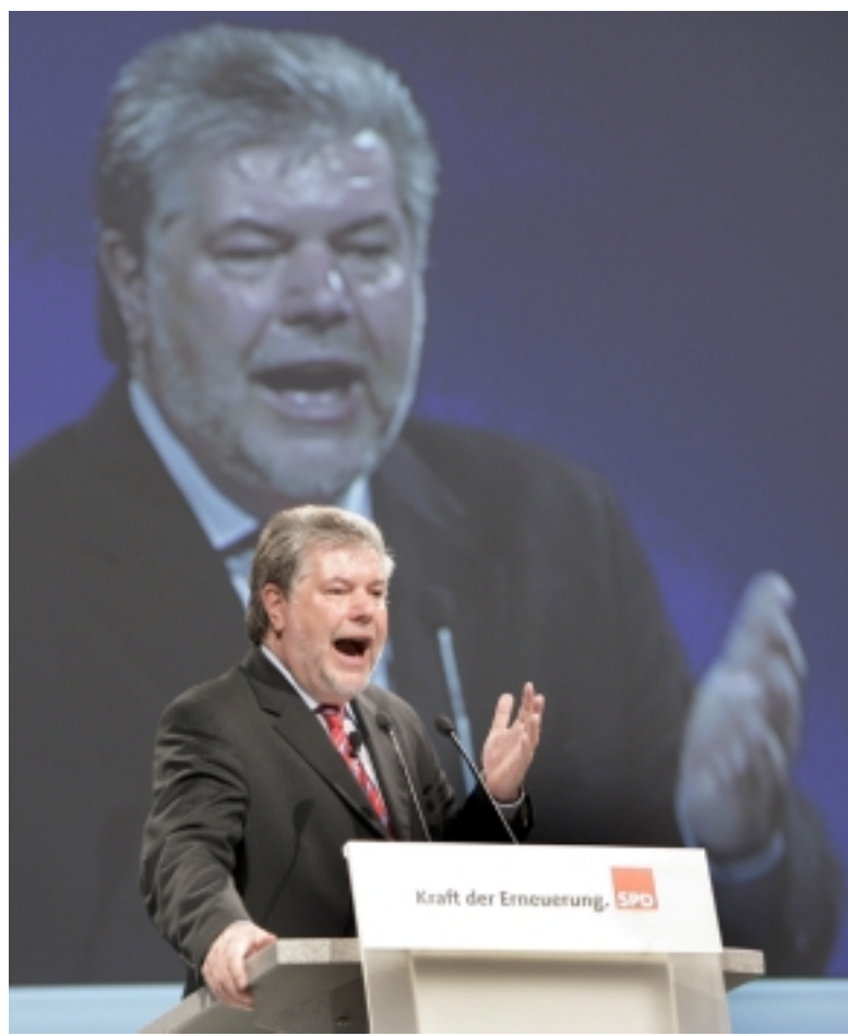
Der designierte SPD-Parteivorsitzende Kurt Beck spricht am Montag in Berlin zum Auftakt der Diskussion über ein neues Grundsatzprogramm der Partei. Unter dem Motto 'Kraft der Erneuerung' rief Beck die Parteibasis zur Mitarbeit auf.

Beck rief die SPD zu einer breiten und auch kontroversen Debatte über das neue Programm auf, das im Herbst 2007 verabschiedet werden soll. Unbequeme Fragen dürften dabei nicht „verkleistert“ werden. Ausdrücklich plädierte Beck dabei auch für militärische Einsätze der Bundeswehr „zum Erhalt des Friedens“, wenn sie vom Völkerrecht gedeckt seien. Zudem müsse die EU künftig eine „stärkere,